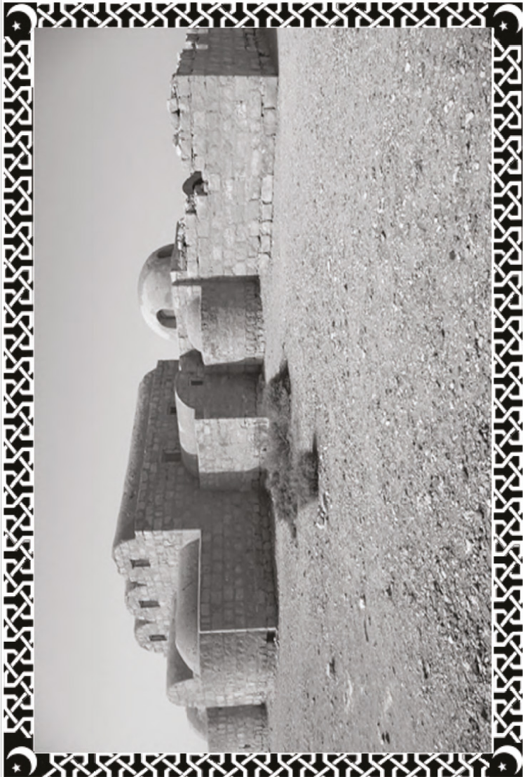
Un ejemplo de una fortaleza islámica temprana de la dinastía omeya (661-750 d. C.).