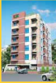
Zigatola Size : 1285 sft