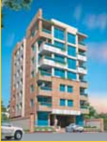
Bashundhara Size : 1285-1750 sft