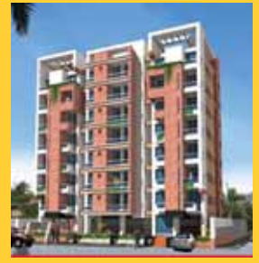
Nordha Size : 1165-1350 sft