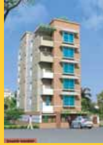
Dhanmondi Size : 1350 sft