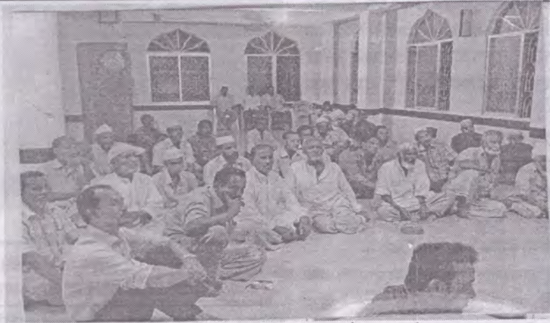
MTA-তে প্রদর্শিত সত্যের সন্ধানে অনুষ্ঠানের দর্শক বৃন্দ