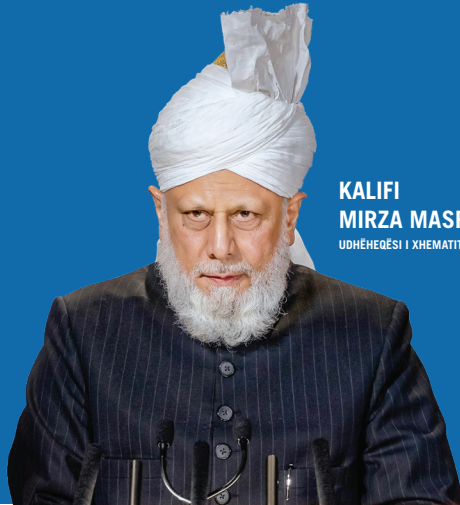
KALIFI MIRZA MASROOR AHMAD UDHËHEQËSI I XHEMATIT MUSLIMAN AHMEDIA

PËR MË SHUMË SE NJË DEKADË KA PARALAJMËRUAR PËR LUFTË BOTËRORE