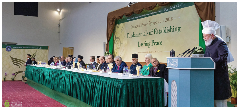
Shenjtëria e Tij, Hazret Mirza Masroor Ahmad, Simpoziumi i Paqes, Mbretëria e Bashkuar, 2018

Në vitin 1905, Themeluesi i Xhematit Musliman Ahmedia paralajmëroi botën për një luftë të tmerrshme globale, e cila do të përmbyste Carin e Rusisë dhe do të sillte një rend të ri shoqëror. Fjalët e tij profetike u përmbushën në Luftën e Parë Botërore 1914–1918. Emri i tij ishte Hazret Mirza Ghulam Ahmad a.s., dhe ai ishte Mesihu i Premtuar, i pritur nga të gjitha fetë e botës.